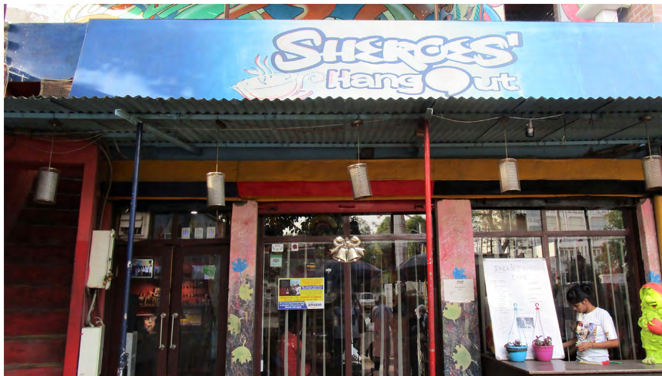
Fachada del Bar Sheroes' Hangout.