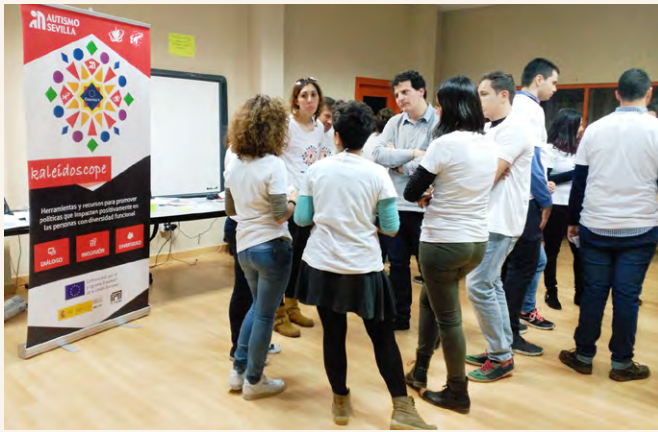
Jóvenes participantes en el Encuentro de Mollina.