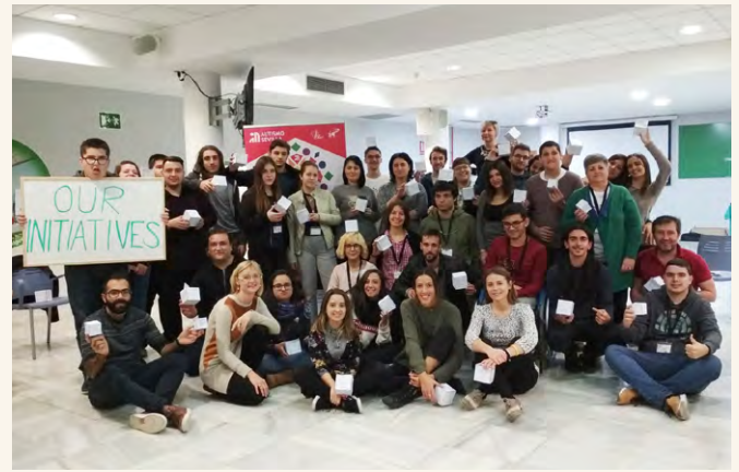
Participantes en el Encuentro de Sevilla.