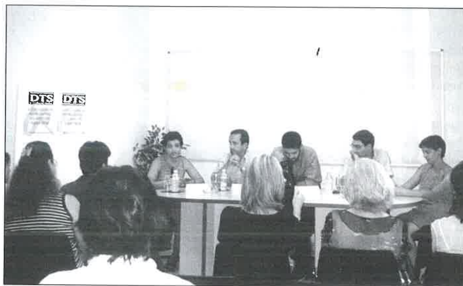
Un momento de la entrega de premios.