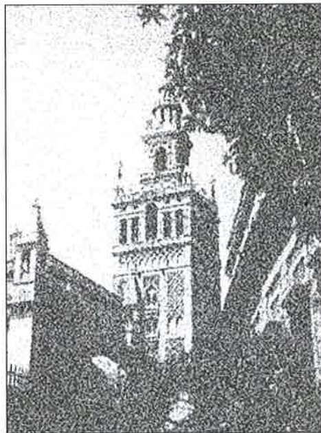
La asamblea se celebró en Sevilla.