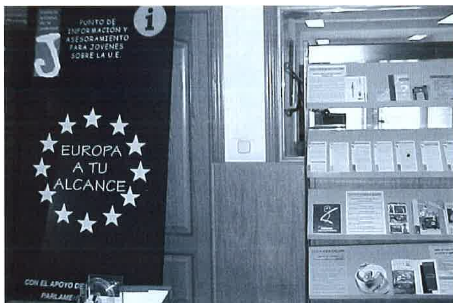
Punto de Información Europeo de la Comunidad Andaluza

enclaves informativos en función de las necesidades prioritarias de cada población concreta. Existen organismos que abordan todo tipo de información para el alumnado universitario -en comunidades estudiantiles fuertes como Granada-; otros que lo hacen desde el ámbito científico y el desarrollo tecnológico -en Málaga o Sevilla- y otros últimos, mayoritarios, que ofrecen información general para particulares y entidades de carácter público y privado.