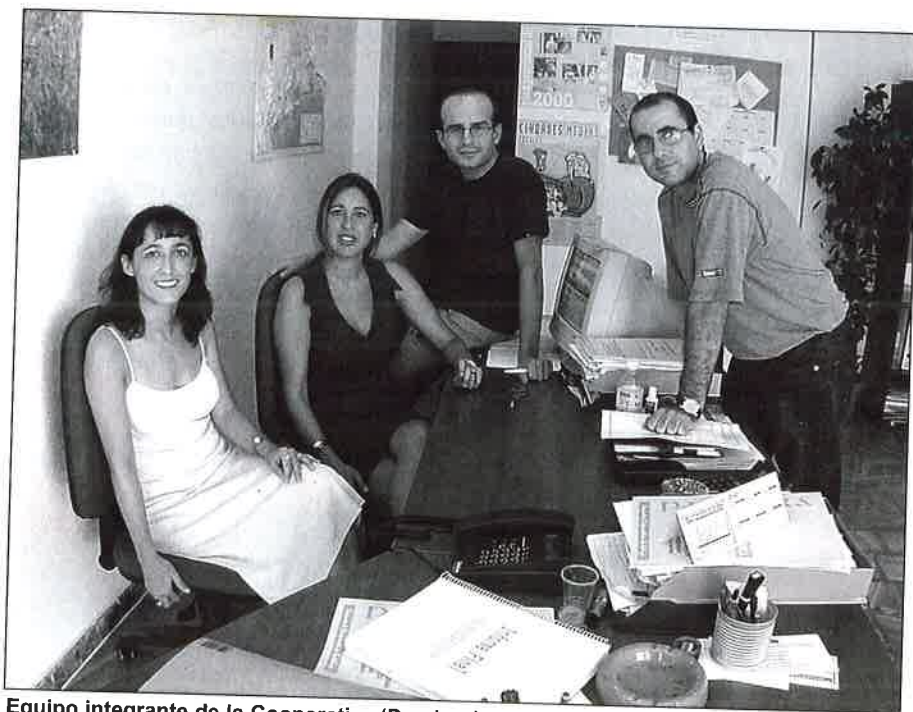
Equipo integrante de la Cooperativa 'Pandora'.

A FINALES del año 1996, un grupo de universitarios, con la carreras del ámbito social recién finalizadas (educación, trabajo social y psicología), decidimos crear la Asociación Pandora Equipo Interdisciplinar, como solución al problema del desempleo que ya comenzaba a convertirse en una realidad en nuestras vidas. Fue un proceso largo y pausado, a lo largo del cual realizamos un análisis exhaustivo de nuestras aptitudes y actitudes, que acabó en la consolidación de la Asociación como promotora de proyectos y programas en los ámbitos anteriormente mencionados. De este modo y manera, a mediados de 1997 comenzamos a desarrollar nuestras primeras actividades de forma profesional. En aquel momento el equipo de Pandora E.I. estaba conformado por: una psicóloga, tres trabajadores sociales, un maestro y una pedagoga.