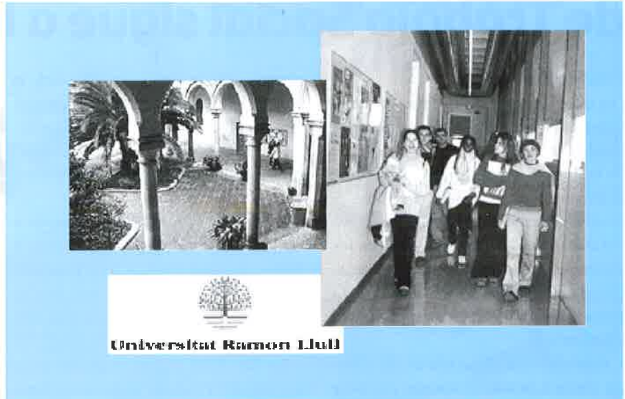
Imágenes de la Escuela Universitaria Ramón Llull.

Esta Escuela Universitaria lleva a cabo este tipo de encuentros desde hace más de tres años, con el objetivo de conocer otras realidades en el ámbito de la acción