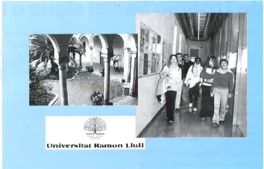
Imágenes de la Escuela Universitaria Ramón Llull.

Esta Escuela Universitaria lleva a cabo este tipo de encuentros desde hace más de tres años, con el objetivo de conocer otras realidades en el ámbito de la acción