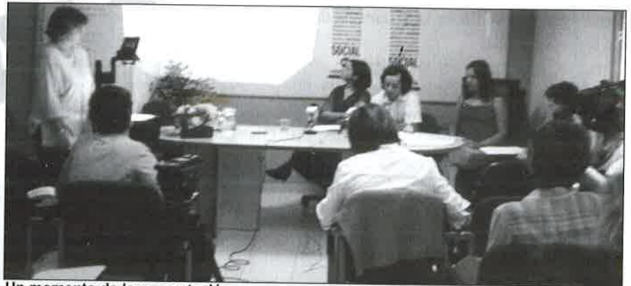
Un momento de la presentación.

El equipo de investigación recabó gracias a 100 encuestas, la información necesaria para este estudio, utilizando cuestionarios en inglés y español, dependiendo de la nacionalidad de las implicadas.