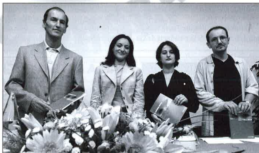
Un momento de la presentación.

La acogida del libro ha sido favorable, como avance en el uso de un instrumento básico y exclusivo de los profesionales Diplomados en Trabajo Social, que permita recoger la realidad personal y social que