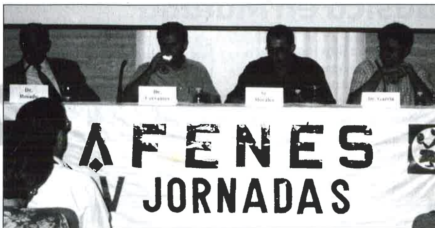
Participantes en las V Jornadas de AFENES.

El contenido de la primera mesa estuvo centrado en los traslados e ingresos psiquiátricos involuntarios, abarcándose la situación desde distintos puntos de vista tanto médicos, familiares como policiales, y realizándose una exhaustiva relación de pautas a seguir durante cualquier tipo de ingreso psiquiátrico, con la conclusión final de una mejor coordinación desde los distintos estamentos. La segunda mesa orientada hacia una visión social de "La Infancia en el mundo moderno", nos sorprendió con un debate abierto, sobre educación y derechos, muy en consonancia con la realidad social actual, donde el Sector de la Infancia a pasado de ser 'Objeto de Derecho' a ser