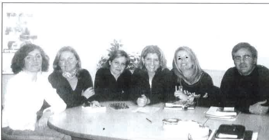
Nueva Junta de Gobierno.

Desean además conseguir un colegio plural y representativo, donde todo el mundo tenga la oportunidad de participar para superar los nuevos retos que a diario se presentan en nuestra profesión en la sociedad actual. El programa de trabajo presentado recoge como principales líneas de actuación: la potenciación de la participación en la vida colegial por parte de los colegiados, la representación, defensa y reivindicación de nuestra profesión en todos los ámbitos posibles, el fomento de la formación e investigación, la búsqueda de nuevas vías de financiación que aseguren la estabilidad de los proyectos iniciados y permitan el desarrollo de nuevas iniciativas, favorecer la capacitación e inserción de