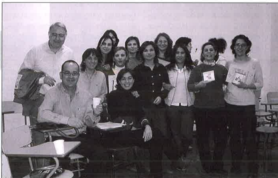
Participantes en el curso.

íntegramente por trabajadores/as sociales, todos/as ellos/as con reconocida experiencia y competencia en cada una de las áreas de trabajo propuestas. Con objeto de orientar sus exposiciones, éstos/as facilitaron un material de apoyo que permitirá al alumnado la reflexión y profundización posterior, y que en breve será puesto, en soporte CD, a disposición de los colegiados.