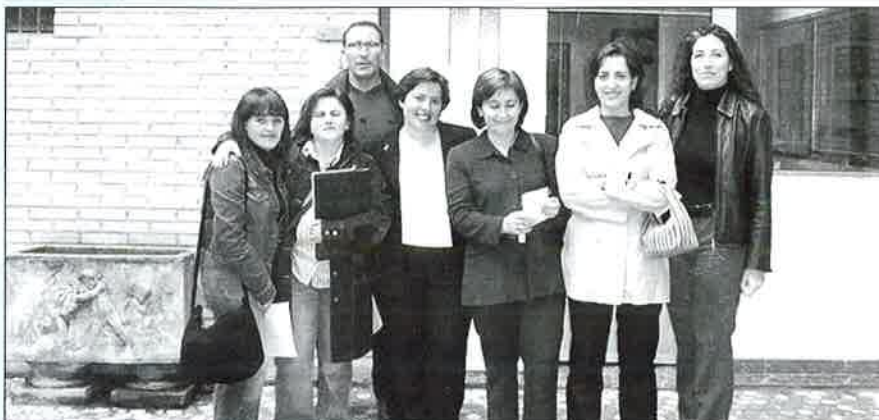
Junta de Gobierno del CODTS de Granada.