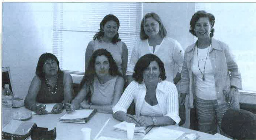
Participantes en las negociaciones sobre el Tipai.

Fruto de ese trabajo, y con la colaboración de todos los colegios que integran el