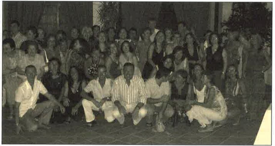
Participantes en uno de los actos conmemorativos del 25 Aniversario.

Al día de hoy ya todos/as han recibido, a través del correo postal, una insignia en plata con el anagrama de la Profesión. La Junta de Gobierno ha querido dejar constancia de que, aunque recientemente se ha modificado el logotipo del Colegio donde aparecía la imagen corporativa, ha pretendido que dicha imagen no pierda su vigencia y que la podamos mostrar como distintivo Profesional.