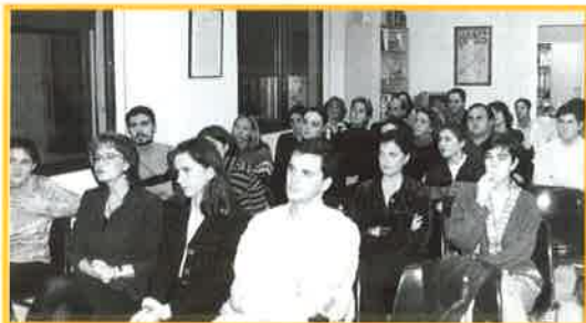
Detalle de los asistentes al Acto.