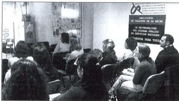
Asistentes al seminario de Visita Domiciliaria.

Desde el Colegio de Trabajo Social se ve primordial que los profesionales vean la entidad como algo de todas y todos, una entidad que sigue creciendo y que necesita de la aportación de todos los profesionales del trabajo social y mucho más aún de aquellas personas que tienen una larga experiencia profesional, por lo que insistimos en la invitación a todos/as a continuar construyendo y colaborando con la profesión desde el Colegio, así como el compromiso de éste a continuar facilitando la información y a seguir contando con todos ellos. Más que un detalle con los que dejan de ejercer, es una invitación firme desde el convencimiento que todas y todos tenemos mucho que aportar, y mucho más los que han tenido la enorme suerte de dedicar muchos años de experiencia al desarrollo de nuestra profesión.