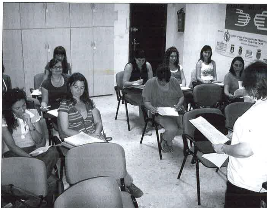
Asistentes al curso de preparación de oposiciones.

El curso preparatorio de la oposición de Trabajo Social para la Junta de Andalucía incluye un temario general con contenidos teóricos sobre Trabajo