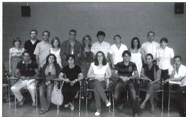
Formadores y participantes del curso.

La temática fue variada. Se trataron contenidos que versan desde la universalidad en Servicios Sociales, intervención con familias desde el modelo sistémico, transversalidad de género, investigación acción participativa y los grupos cooperativos, la entrevista motivacional, etc. Todo ello entrelazado y amenizado con diversas dinámicas, grupos de discusión y técnica DAFO. Entre las conclusiones extraídas de la formación destaca: el trabajador social respecto a