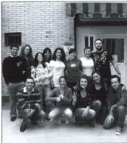
Alumnos/as y Monitor del Curso Comunicación en Lengua de Signos Española.