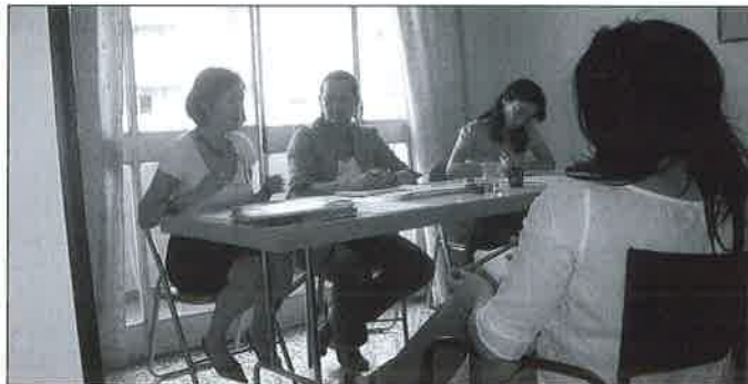
Momentos de la asamblea general.