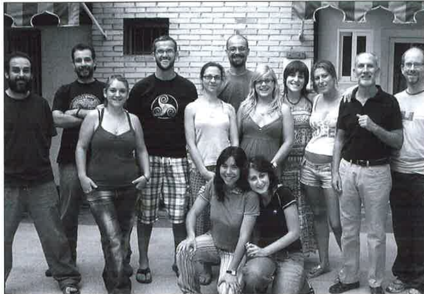
Alumnos/as y Monitora del Curso de Formador Ocupacional.