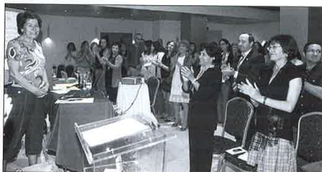
Ovación a la homenajeada.

Las personas asistentes pudieron disfrutar de un cóctel servido en el bello aljibe árabe del hotel. Desde la revista la Junta de Gobierno quiere agradecer a las colegiadas, colegiados y personalidades que nos acompañaron la respuesta a la convocatoria, así como las muestras de cariño y felicitaciones recibidas.