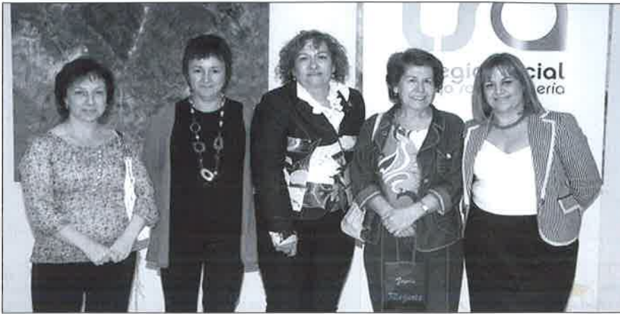
Miembros de Junta Gobierno y personal de administración con Patro.