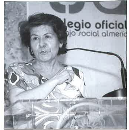
Agradecimiento de Patro.