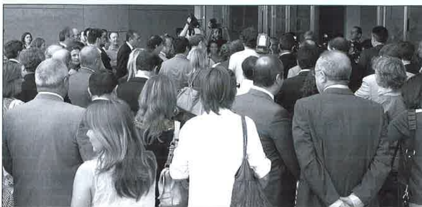
Numerosa asistencia a la inauguración.