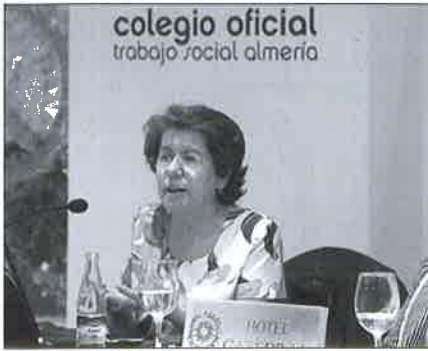
Momento de la conferencia.