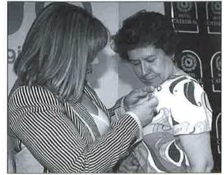
Imposición de la condecoración.