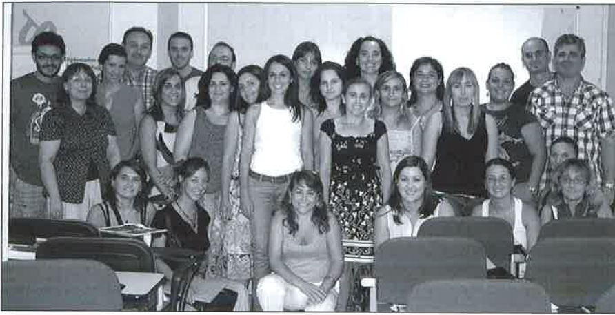
Participantes en el curso junto a la formadora.