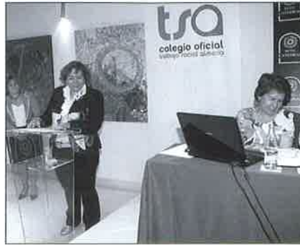
Lectura del acta.