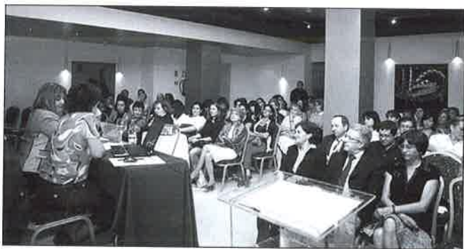
Vista del aforo durante el acto.