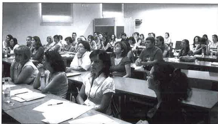
Participantes en el curso.