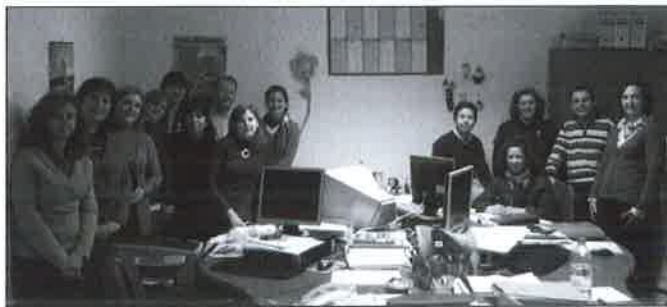
Sesión SS.SS.CC. Antequera.

El tercer modelo de recogida de cuestionarios se ha realizado a través de la organización de Sesiones informativas presenciales celebradas en: Distrito Municipal Carretera de Cádiz: 10 asistentes, Distrito Cruz de Humilladero: 13 asistentes, Reunión TS Axarquía