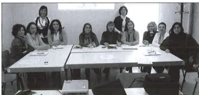
Sesión informativa Distrito Municipal Carretera de Cádiz.