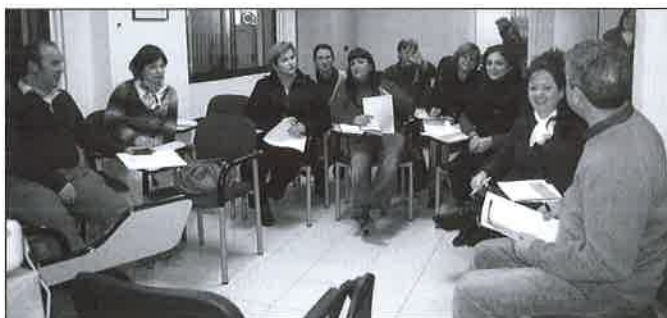
Comisión de riesgos psicosociales del CODTS de Málaga.

(Rincón de la Victoria, Vélez Málaga, Nerja): 21 asistentes, Sesión en Ayuntamiento de Antequera: 14 asistentes, Distrito Sanitario Málaga Servicio Andaluz de Salud: 8 Asistentes y Ayuntamiento de Marbella 9 asistentes.