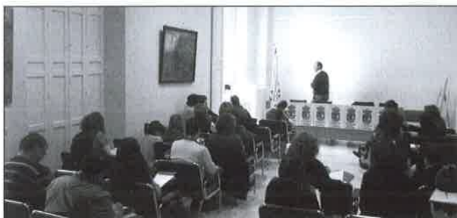
Sesión TS Axarquía.