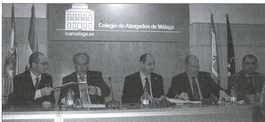
Momento de la firma del Convenio.

Los cinco Colegios Profesionales se felicitaron por tratarse de una experiencia novedosa en España, puesto que en ella se