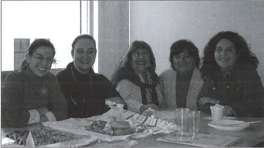
Momento dulce tras la reunión.