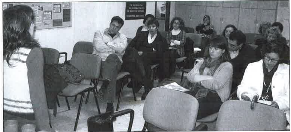
Presentación de la Memoria 2009