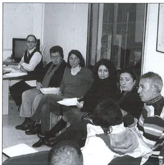
Momento de la Asamblea General.

giado-, la Formación prevista, el Plan de Comunicación o la colaboración institucional.