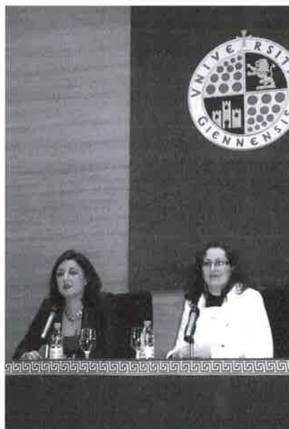
Momento de inauguración de las jornadas.