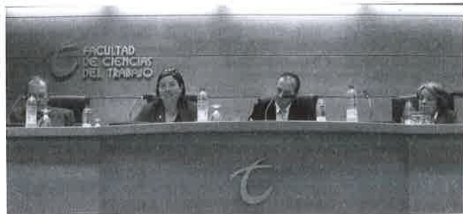
Seminario de Mayores.