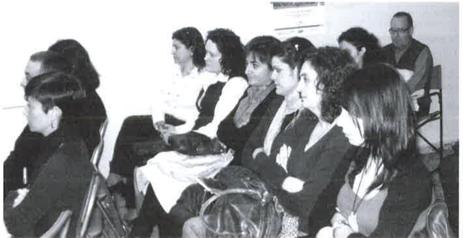
Asistentes a la Asamblea.

Desde la Junta de Gobierno se espera que los nuevos servicios de los que se dispone para el año 2010 sean útiles, eficaces y del agrado de todo el colectivo.