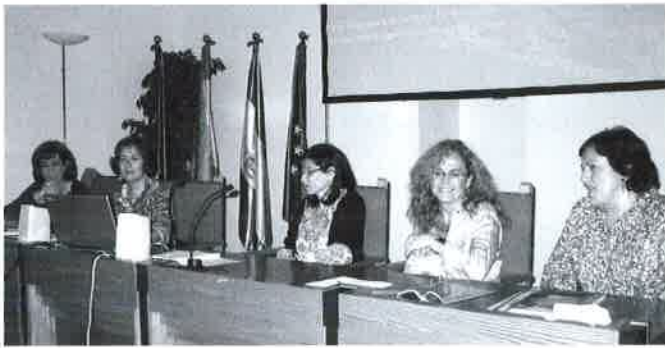
Candidatas a trabajadora social del año.