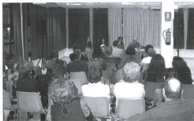
Asistentes a la celebración del Día de los Derechos Humanos del CODTS Granada.

guerras mundiales como profundas crisis económicas -la de 1929, 1973, y la actual, por ejemplo- y que pretende poner fin a la pobreza y establecer una condición de igualdad respecto a los demás.