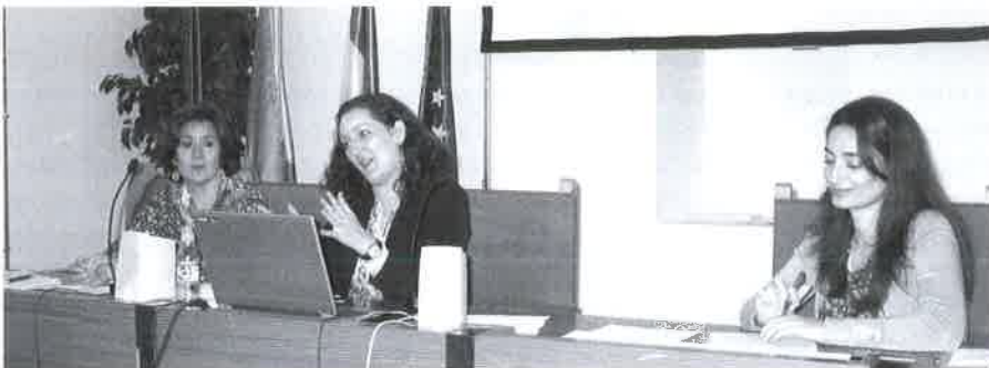
Momento de la Asamblea General.