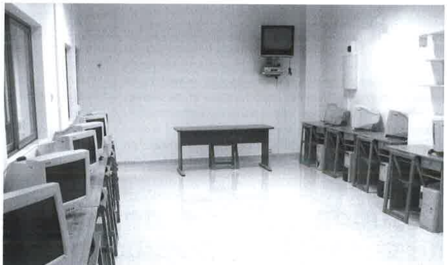
Aula de Formación e Internet.