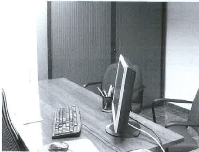
Secretaría del Colegio.