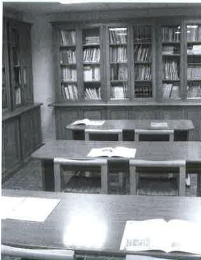
Biblioteca y sala de consulta.

Desde aquí invitamos a tod@s a visitar las instalaciones y a participar del colegio. Permanecerá abierto en horario habitual de lunes a viernes de 9.00h a 14.00h y de 17.00h a 20.00h.