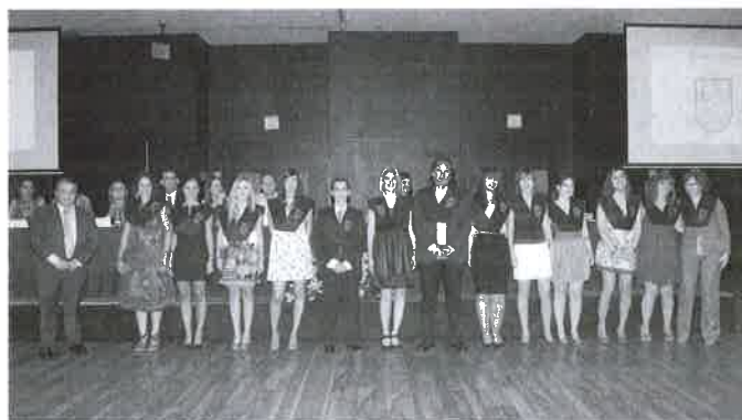
Alumnado del Master de Mediación Familiar y de Intervención Social y Dependencia.