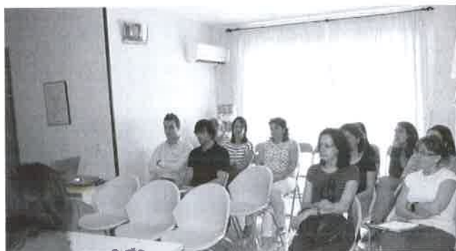
Asistentes a la Asamblea.