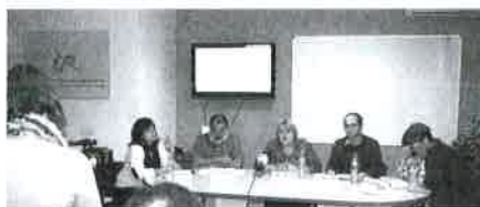
Instantánea de la rueda de prensa celebrada en el Colegio.

Durante la presentación se hizo repaso a la situación de crisis económica que está produciendo un aumento de la desigualdad, la pobreza y la exclusión social en nuestro país que viene provocando un incremento de la demanda de servicios y prestaciones, de ahí que sean más necesarios que nunca los Servicios Sociales. Se habló de crisis, de recortes, de la ralentización de la Ley de la Dependencia, del aumento significativo