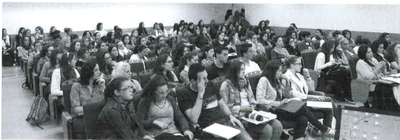
Vista general de la Salón de Grados de la Universidad de Málaga.