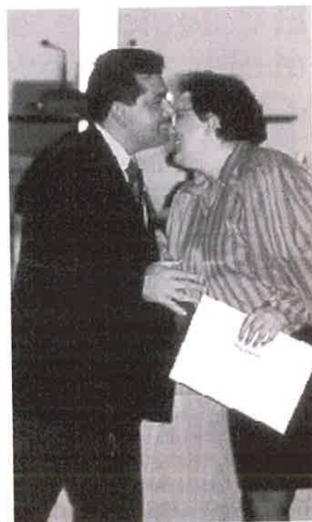
Momento de la entrega de diplomas.

Con ello, el Colegio de Cádiz, pionero en ofertar plazas para prácticas profesionales, continúa trabajando en esta labor para que sus colegiados puedan seguir formándose y adquiriendo experiencia, que tan necesaria es en la profesión, con el fin de mejorar el desempeño de sus funciones.