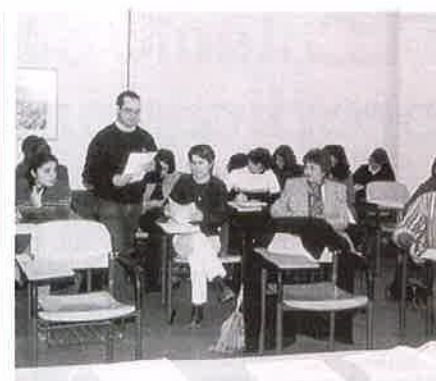
Asistentes al curso de mediadores.

Por otro lado, se plasmó la necesidad de difundir el papel que el trabajo social puede realizar en otros campos, ajenos a aquellos a los que históricamente ha atendido; la importancia de una formación continua encaminada al ejercicio libre y la imprescindible introducción de técnicas de Marketing propias del sector empresarial. La exposición de los diversos pasos a seguir para la puesta en marcha de una empresa dedicada a los diversos aspectos relacionados con los servicios sociales, sirvió de base a la reflexión posterior por parte de los asistentes, quienes participaron activamente en el debate que siguió a la conferencia y que cerró el acto.