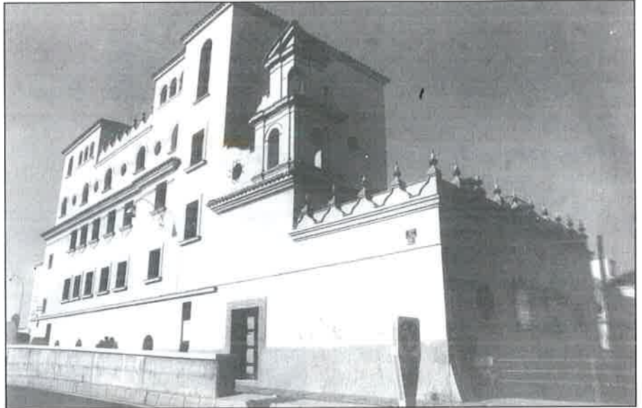
Fachada de la Escuela Universitaria de Trabajo Social.

Además, la Universidad de Málaga ya ha efectuado la convocatoria de plazas docentes para los profesores de esta escuela.