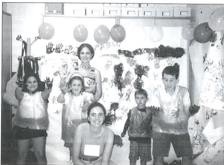
En la ludoteca se celebró una fiesta infantil.