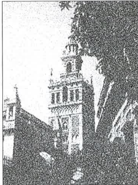
La asamblea se celebró en Sevilla.