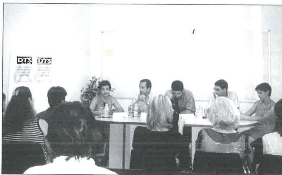
Un momento de la entrega de premios.