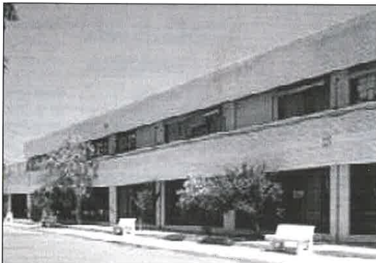
La Casa del Estudiante en El Ejido

El programa va dirigido a aquellas personas mayores que puedan valerse por sí mismas y que sólo requieran