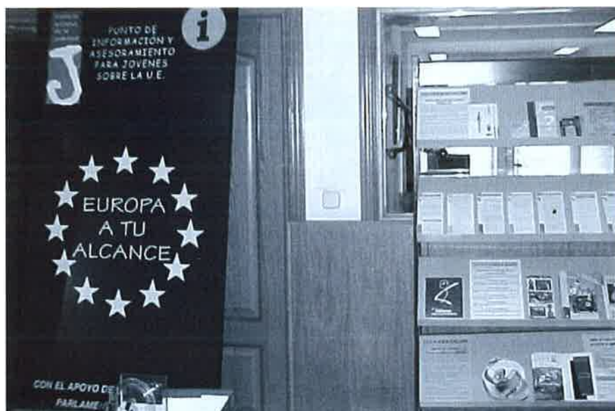
Punto de Información Europeo de la Comunidad Andaluza

enclaves informativos en función de las necesidades prioritarias de cada población concreta. Existen organismos que abordan todo tipo de información para el alumnado universitario -en comunidades estudiantiles fuertes como Granada-; otros que lo hacen desde el ámbito científico y el desarrollo tecnológico -en Málaga o Sevilla- y otros últimos, mayoritarios, que ofrecen información general para particulares y entidades de carácter público y privado.