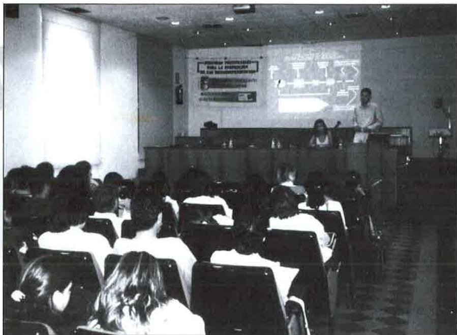
Un momento de las jornadas.