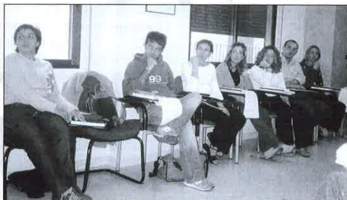
Integrantes del Curso.

La metodología que se ha utilizado ha sido activa y participativa, basada en los métodos expositivo e interrogativo para adquirir las habilidades necesarias en la construcción y comprensión de supuestos prácticos en Trabajo Social. También se ha