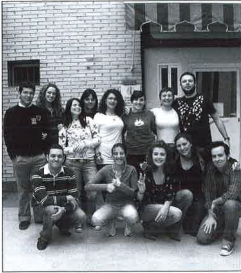
Alumnos/as y Monitor del Curso Comunicación en Lengua de Signos Española.