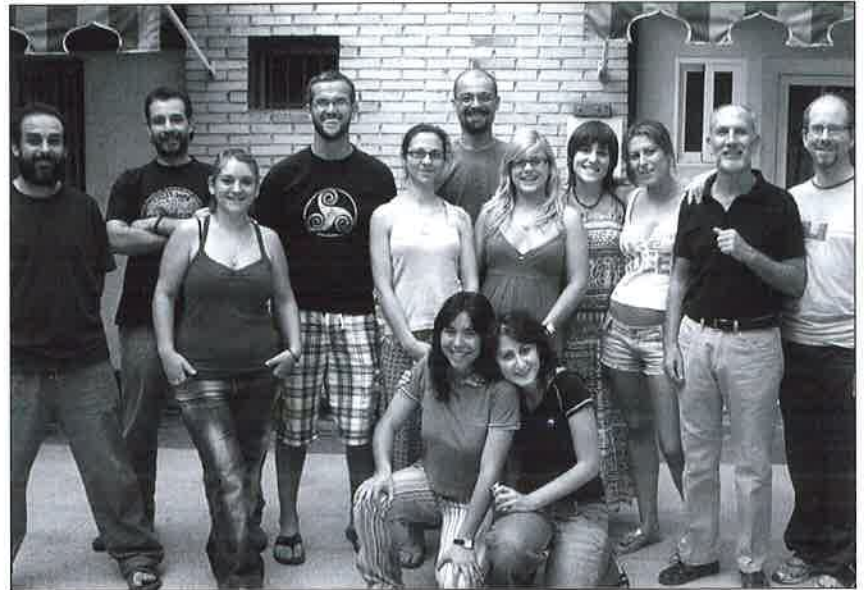
Alumnos/as y Monitora del Curso de Formador Ocupacional.