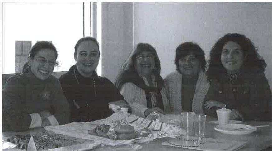
Momento dulce tras la reunión.