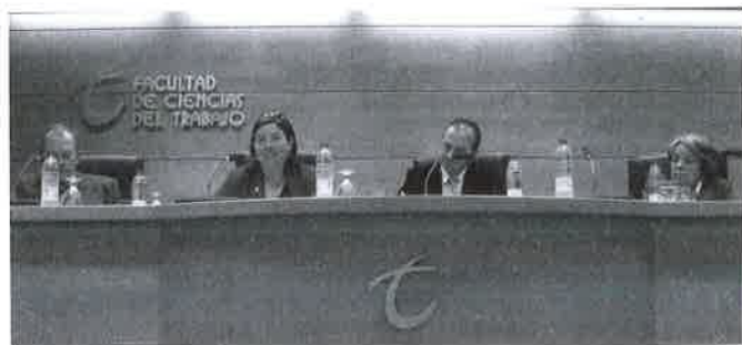
Seminario de Mayores.