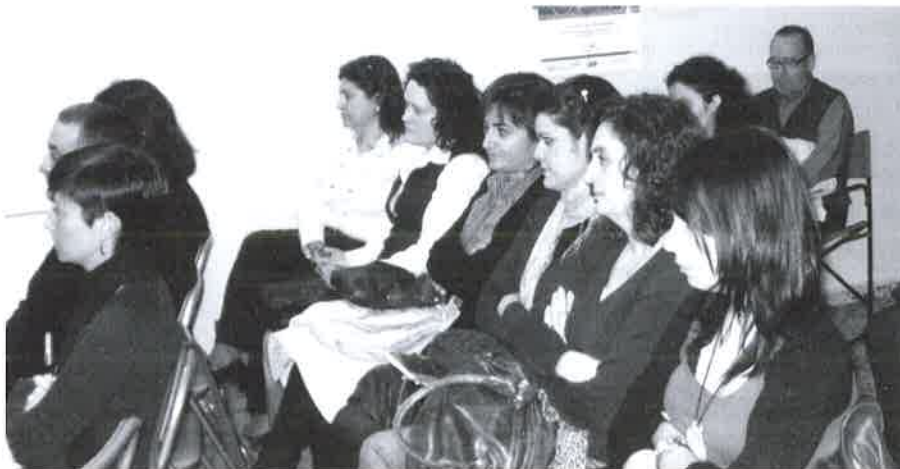
Asistentes a la Asamblea.

Desde la Junta de Gobierno se espera que los nuevos servicios de los que se dispone para el año 2010 sean útiles, eficaces y del agrado de todo el colectivo.