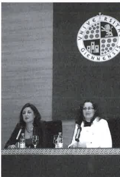
Momento de inauguración de las jornadas.