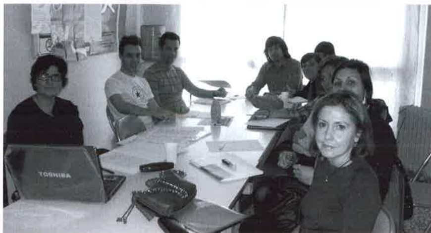
Participantes en la charla-coloquio.