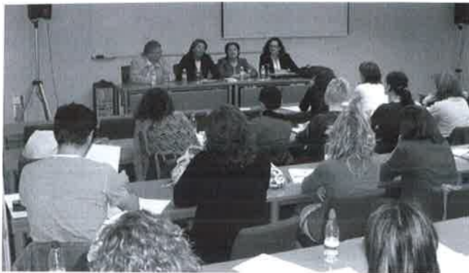
Presentación del Curso de Mediación.