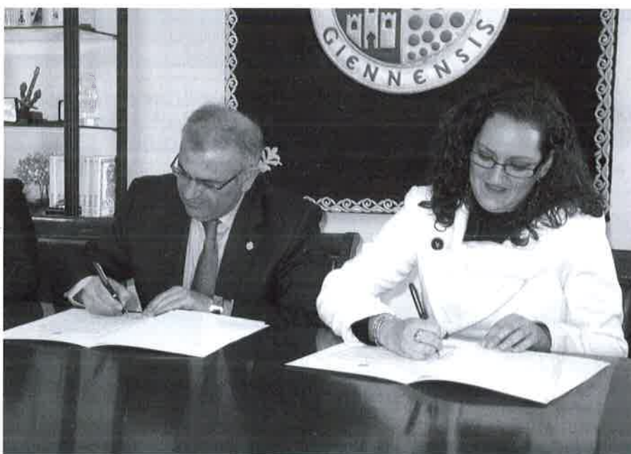
Momento de la firma del Convenio.