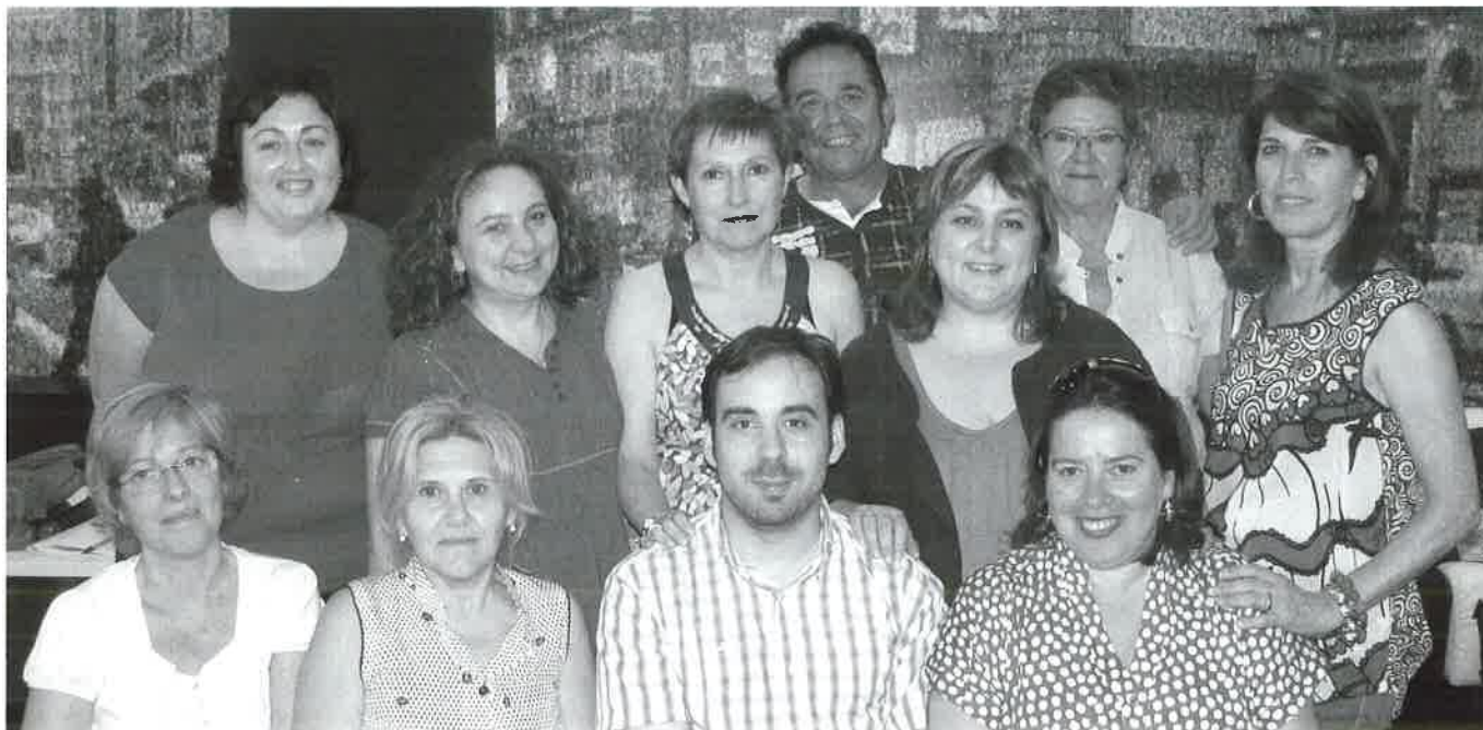
Componentes de la nueva Junta de Gobierno.