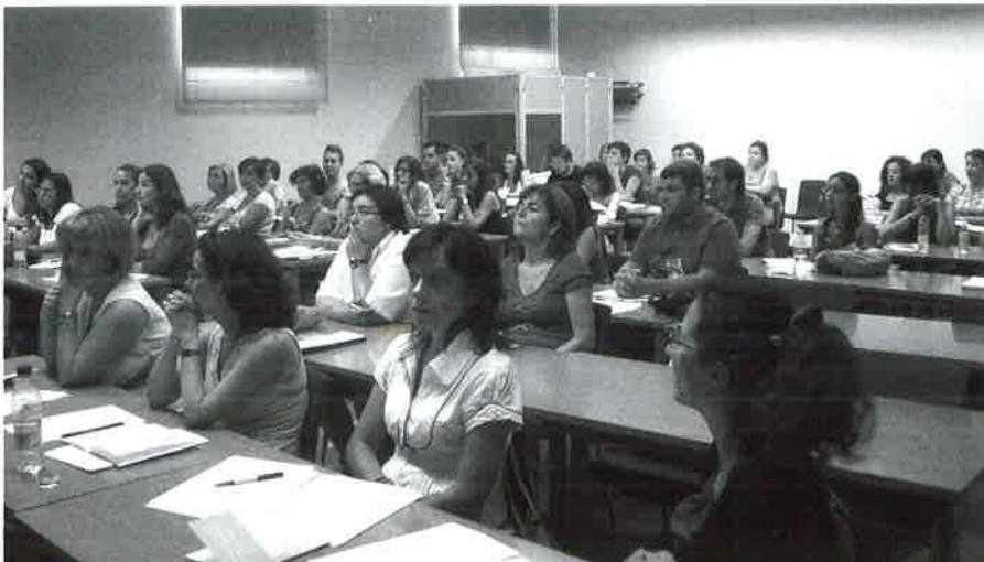
Foto de archivo de formación en peritajes sociales.