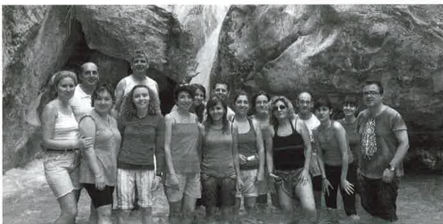
Participantes en esta interesante experiencia.