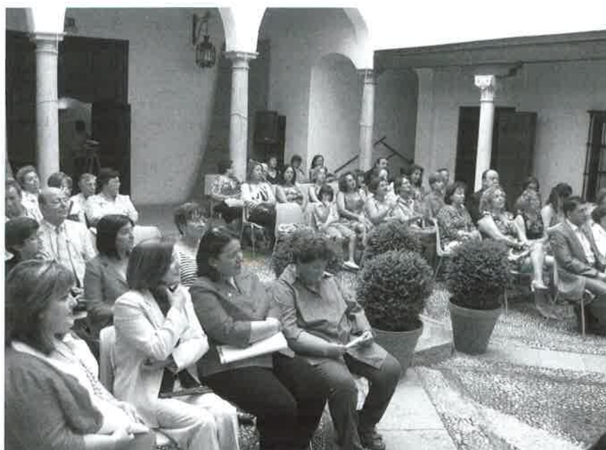
Asistentes al acto.

La homenajeada dio las gracias por las palabras y mencionó su trayectoria como Trabajadora Social (Asistente Social, de las de antes) y nombró a mu-