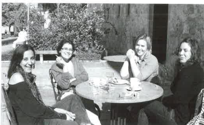
Momentos de relax en el Curso de Mediación.