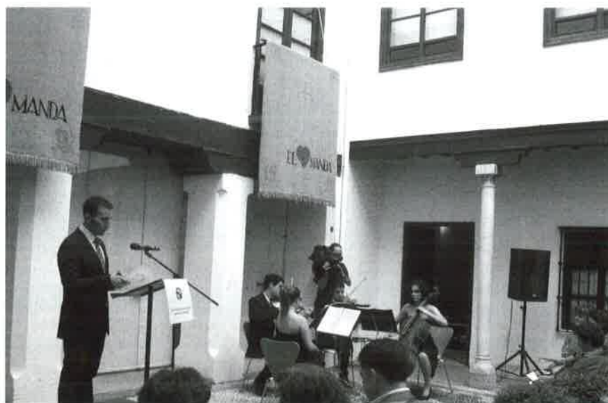
Intervención amenizada por Acciocorda .