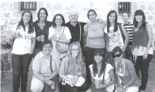
Asistentes al curso de Peritajes Sociales.