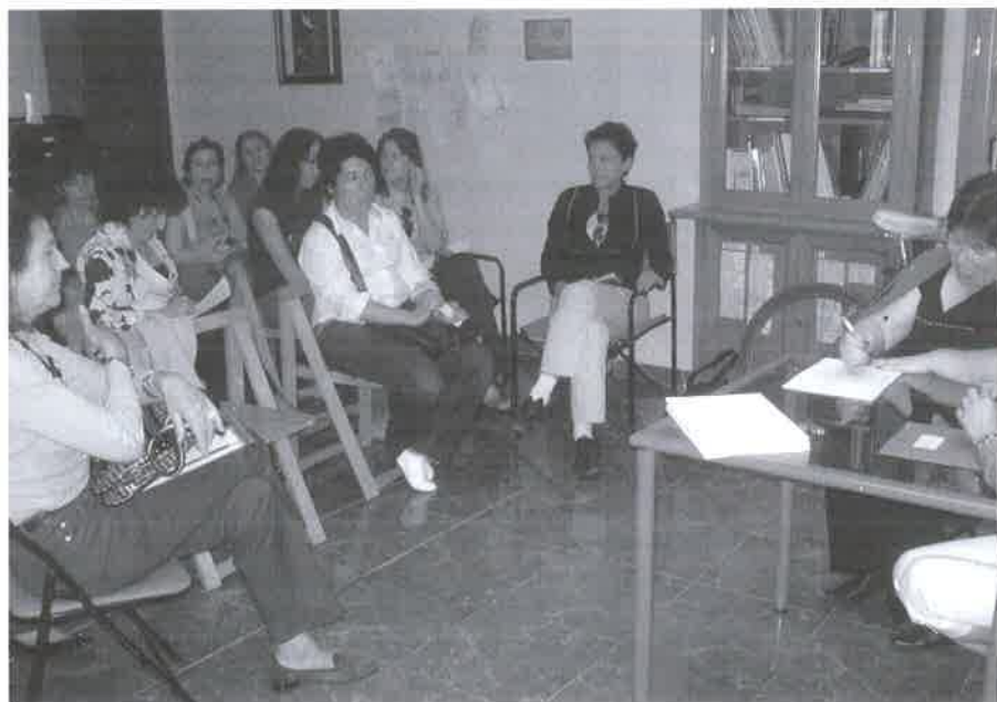
Asistentes a una de las charlas de Mediación.