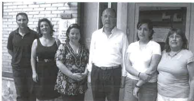
Miembros del PP de Granada con representantes de la anterior Junta de Gobierno.