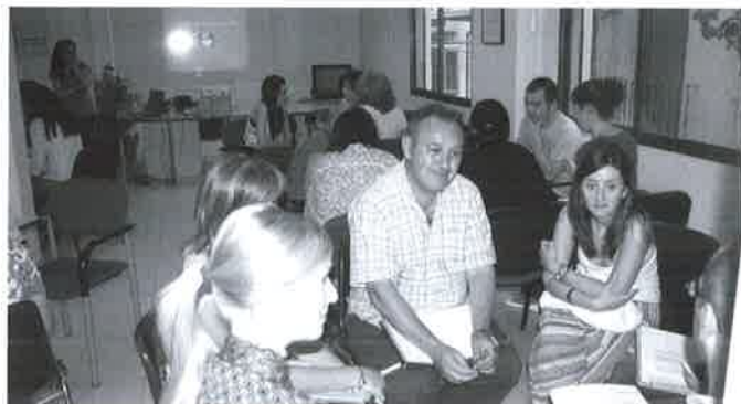
Grupos prácticos de debate durante el curso realizado.