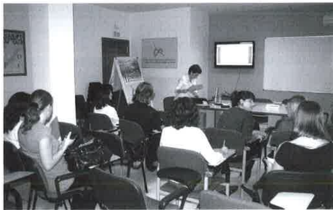
Momento del curso.

inferiores a la renta básica de subsistencia pero cuentan con los apoyos familiares y sociales suficientes que les evita caer en la exclusión social.