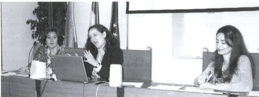
Momento de la Asamblea General.