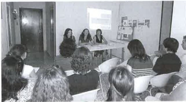
Momento de la Asamblea.