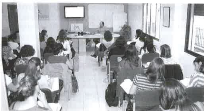
Grupo 1 del Curso Oposiciones.