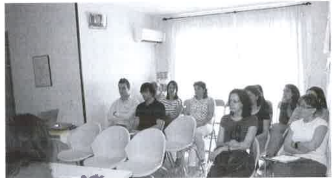
Asistentes a la Asamblea.