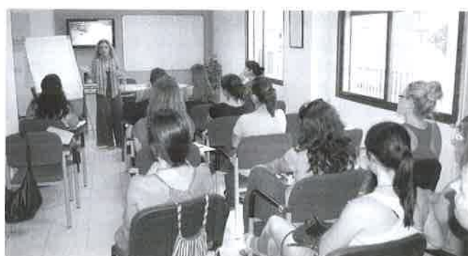
Grupo 2 del Curso Oposiciones.