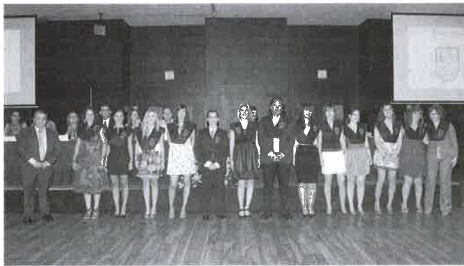
Alumnado del Master de Mediación Familiar y de Intervención Social y Dependencia.