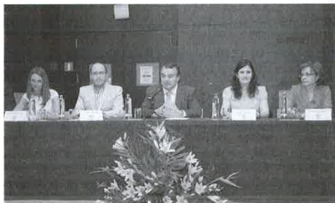
Mesa de ponentes. En el Centro el Director del C.E.J. y la presidenta del Colegio.

otras titulaciones. Desde el Colegio felicitamos a los/as graduados/as y al Centro de Estudios Jurídicos, y destacamos la importancia de la formación continua y el reciclaje como apuesta por el compromiso con la profesión y la calidad del trabajo.