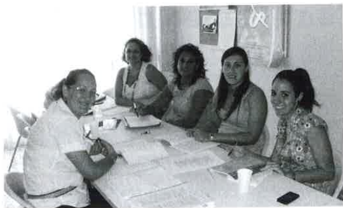
Grupo de opositores.